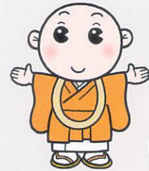
一隅を照らす 運動キャラクター しょうごうさん

新型コロナウイルス感染症拡大予防対策として今年の特例祈禱は一般席にも定員を設けて予約制とし、内陣特別席は各日10名様限定とさせていただきます。また全席指定とし、堂内に座席を設けさせていただきます。堂内で行われます法要のため、各自マスクをご着用の上お越しください。換気には配慮しておりますが、館内設置の消毒用アルコール液の利用のご協力をお願いいたします。発熱等の症状がある場合はご来山をご遠慮ください。